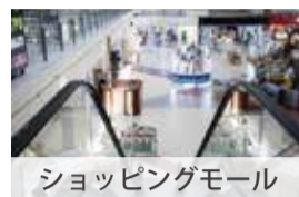
ショッピングモール