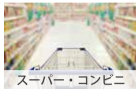
スーパー・コンビニ