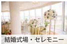
結婚式場・セレモニー